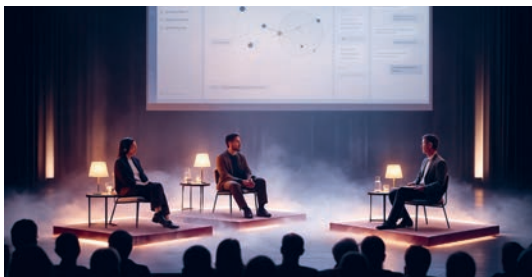
1 | Darstellung der Performance, vom Künstler generiert (AI-unterstützt), 2025. © Cem A, auch bekannt als freeze_magazine

In diesem Format werden die Zuschauenden zu aktiven Forschenden, die in Echtzeit unerwartete Überschneidungen und radikale Widersprüche beobachten können. Durch semantische Live-Analysen werden die Antworten der Redner:innen auf der Bühne visualisiert. In Kooperation mit dem Internationalen Sommerfestival Kampnagel.